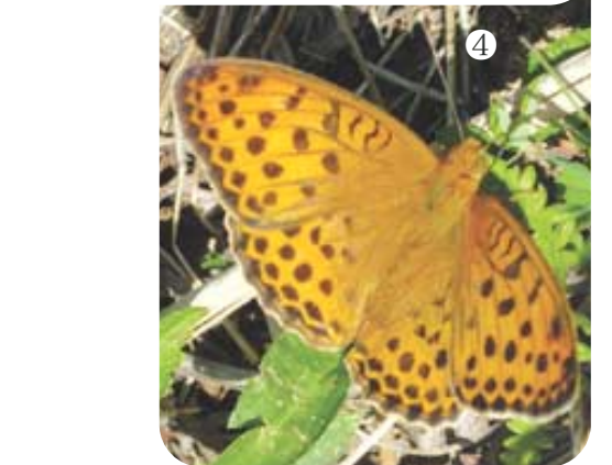
① 각황전 뒤 내화숲을 조성하면서 동백나무를 이용한 것은 동백잎이 불에 강하기 때문이다. ② 구층암 옆 계곡에는 물까마귀가 산다. 물까마귀는 번잡하고 소란스러움을 싫어한다는 점에서 수행자들의 벗이 될 만한 새이다. ③ 미유기는 우리나라에서만 나타나는 고유어종이다. ④ 흰줄표범나비는 장마가 끝나고 불벌터위가 시작되면 여름잠에 들었다가 가을에 다시 나타난다.