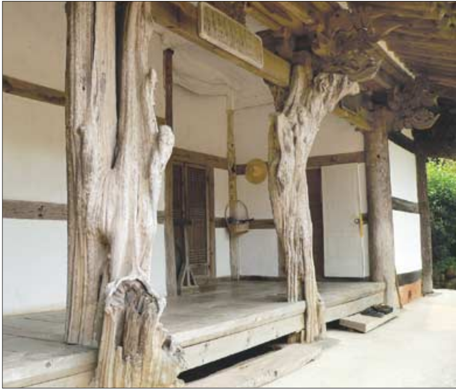
구층암 요사채 기둥은 다듬지 않은 모과나무이다. 근육질의 나무결과 웅이까지 여여하게 드러나 있다(왼쪽). 금정암은 바구니 암자답게 경내로 들어가는 길이 예쁘다(오른쪽).