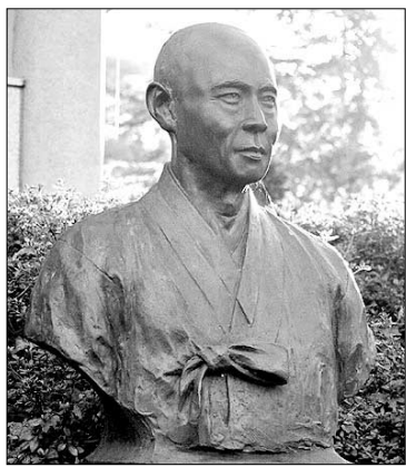
만해기념관의 만해 스님 흉상.

책에서는 <채근담> 원문을 생략하고 만해 스님의 해설만 가려 '수양과 성찰' '마음 자리' '평가와 토론' '마음의 여유' '처세와 수양의 논리'로 나누어 정리했다. 여기에 효림 스님이 만해 스님의 글에 대한 간단한 감상을 덧붙였다. 효림 스님은 "정선강의 채근담"은 그 문장이 더할 수없이 아름다운 것은 물론, 일생을 수행하는 승려이자 독립시자로 살았던 스님의 사상과 철학·처세술 등이 모두 담겨 있다"고 말한다.