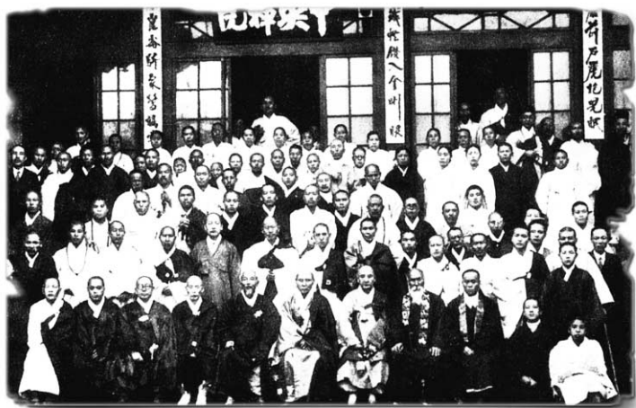
선학원에서 열린 조선불교선종 제1회 수좌대회(1931년 9월 14일).

'한국불교선리연구원(이하 선리연구원)'을 개원한 (재)선학원은 선학원의 역사를 담고 있는 일체의 자료를 찾습니다. 이를 소장하고 계신 스님과 불자님은 연락을 주십시오. 단 한 건의 자료라도 좋습니다. 기증해주신 자료들은 선리연구원에서 그 성격에 따라 분류 및 보존하며, 선학원의 역사와 위상 정립을 위한 자료로 적극 활용됩니다.