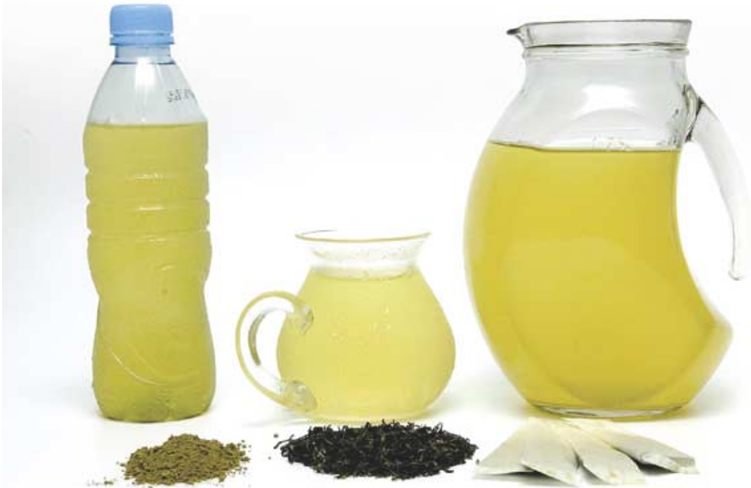
흔히 녹차라고 하면 뜨겁게만 마셔야 한다고 생각하지만, 여름을 맞아 찬물에 우릴 수 있는 티백이나 가루녹차, 캔 음료 등이 다양하게 선보이고 있다.