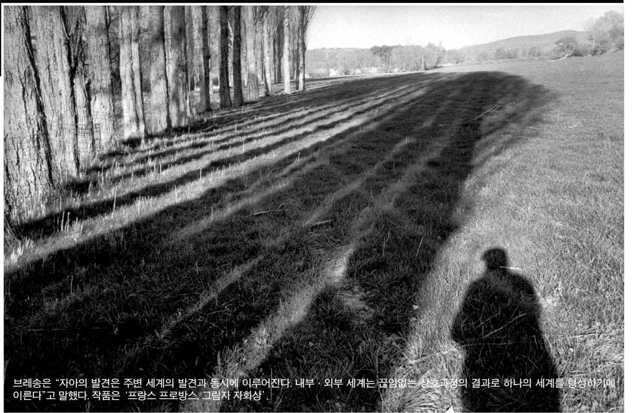
브레송은 "자아의 발견은 주변 세계의 발견과 동시에 이루어진다. 내부·외부 세계는 끊임없는 상호 과정의 결과로 하나의 세계를 형성하기에 이른다"고 말했다. 작품은 '프랑스 프로방스 그림자 자화상'.

브레송이 잡아내는 찰나의 대상은 인물과 풍경 등 다양했다. 특히 그는 20세기를 빛낸 지식인들의 사진을 많이 찍었다. 사진평론가 최봉림씨는 "일종의 공사, 저격수의 시선으로 모델들의 내면과