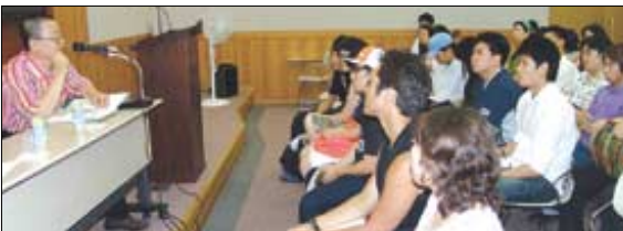
6월 25일 열린 '선(禪)의 찰나와 앙리 카르티에 브레송' 세미나 현장.