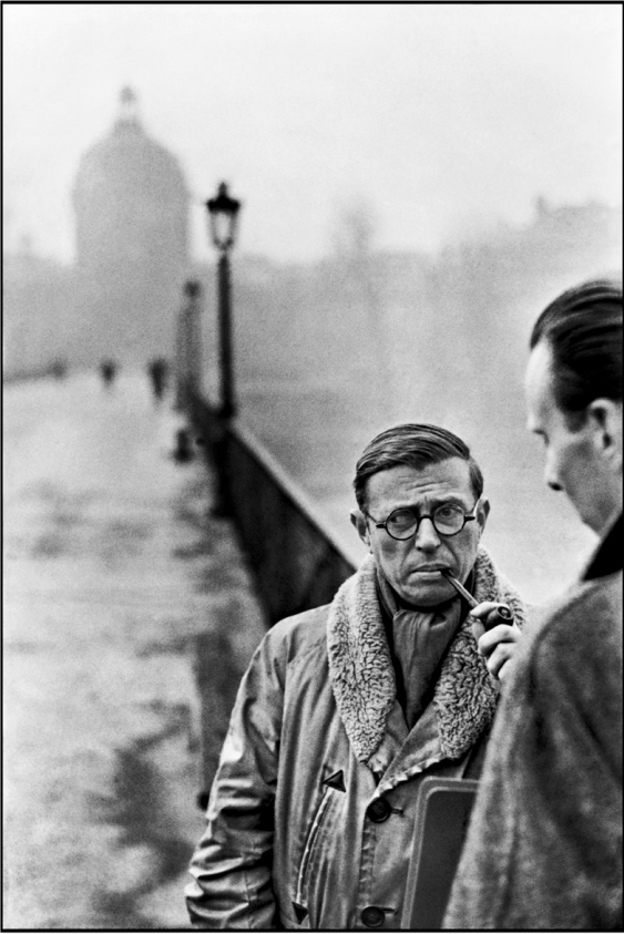
브레송이 찍은, 파이프를 물고 있는 사시(斜視)의 사르트르. 사르트르는 노벨문학상을 거부한 20세기 실존주의 철학자의 표상이 됐다.

“나는 때를 기다리는 신경다발이다 사진가는 문벌이나 판단을 하지 말고 항상 주시자로 남아있어야 한다 주시는 진리를 만날 수 있는 유일한 길이다”