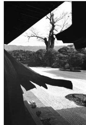
브레송의 작품 '다이트쿠지'.

사진작업도 수도의 과정과 별반 다르지 않았다. 선승들이 매 순간 회두참구에 몰입하는 것과 마찬가지로 브레송은 "집중되는 찰나에 숨을 죽이고 나를 포함한 모든 결정적인 것을 그 찰나에 개입시킬 것"을 강조했다. 깨달음을 위한 선사들의 치열함을 대변