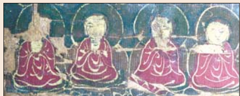
불화 중심에 모셔진 비로자나불(위)과 본존불 주변에 배치된 7000여위 작은 불상들 부분(아래)