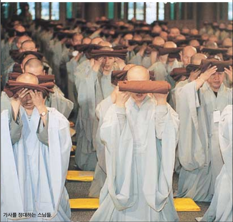
가사를 정대하는 스님들.