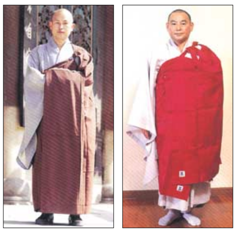
조계종의 대가사(좌)와 태고종의 대가사. 가사가 흘러내리지 않도록 가사와 같은 색의 끈으로 연봉매듭과 고리를 만들었다. 조계종에서 착안한 이 착장구는 한국불교 가사의 특징 가운데 하나다.

있으며, 9조는 6급 법계인 정법승·13조는 5급 법계인 대력을 품수해야 착용할 수 있는 가사다. 21조 가사는 2급 법계 종사인 스님이 입는 가사로, 대각구사의 가사를 토대로 했다. 삼죽오, 토끼, 금강저, 불·보살·경전 등의 문양을 사용하고 법계에 따라 가사의 색을 보라색(9조), 갈색(13조), 주홍색(21조, 25조) 등으로 차별을 둔다.