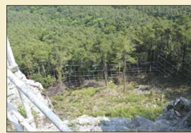
케이블카 상부 정류장 공사로 적지 않은 수목들이 잘려나갔다.

1996년 6월 통영시가 관광케이블카 사업 추진계획을 수립하면서 시작된 미륵산 케이블카 설치 사업은 총 173억원의 예산을 투입해 케이블카 왕복운행에 필요한 정류장을 설치하는 사업이다. 애초 2002년 5월 완공을 목표로 추진됐지만, 그동안 지지부진하게 이어져오다 지난해 12월 공사를 재개해 현재 40%의 공정에 이른 상황이다.