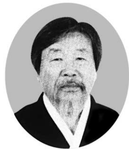
육경신을 통한 천의선도 대중선사

한편, 불국사는 열반사가 위치한 야탑3동 이웃돕기로 공양미 110포를 주민대표에게 전달했다. 글·사진·고영배 기자