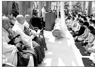
성타 스님이 사부대중의 노고를 치하하고 있다.

목조법당 부석사 무량수전 양식을 본판 분당 열반사 상량식이 5월 31일 열렸다.