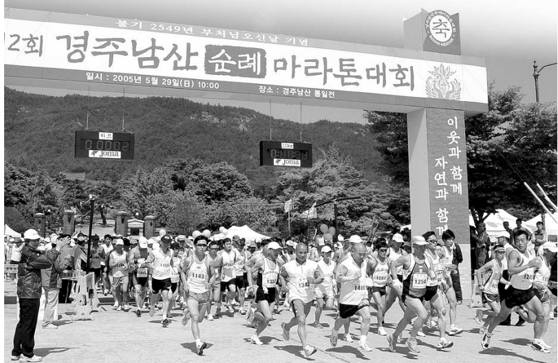
제2회 경주 남산순례 마라톤대회가 5월 29일 1200여명이 참가한 가운데 열렸다.