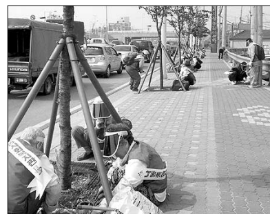
APEC 성공개최를 위해 지역의 노인들이 땀을 흘리고 나섰다.

낙동종합복지관(관장 임광수) 노인일자리창출사업 지역환경지킴이단에서 활동하고 있는 지역 어르신 31명은 5월 30일 김해 공항로 도로변 환경 개선에 지속적으로 참여하게 되며 앞으로 깨끗한 부산을 가꾸기 위해 환경 정화 구역을 확대해 나갈 방침이다.