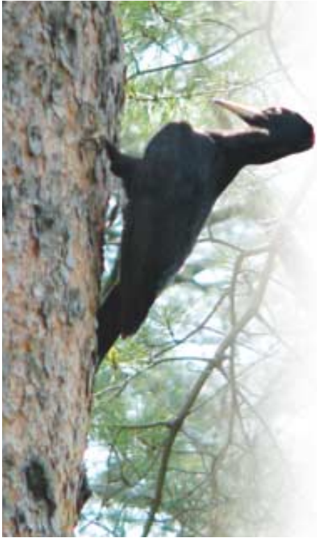
까막딱다구리는 크낙새 다음으로 몸집이 큰 새이다. 지난 1988년 이후 법흥사의 오랜 지표종이 되었다.

영월 사자산 법흥사는 자장율사가 부처님의 진신사리를 봉안해 세운 적멸보궁의 하나이다. 법흥사가 크게 일어난 것은 정효대사가 이곳에 구산선문의 하나인 흥녕선원을 짓고 사자산문을 열고부터이다.