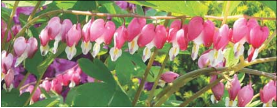
금강화는 사자산의 청정성을 가장 잘 보여주는 식물이다.