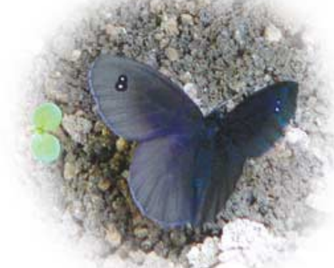
외눈이지옥사촌나비는 이름이 풍기는 이미지와는 달리 화사한 5-6월에 나타나 꽃의 꿀을 찾는다.