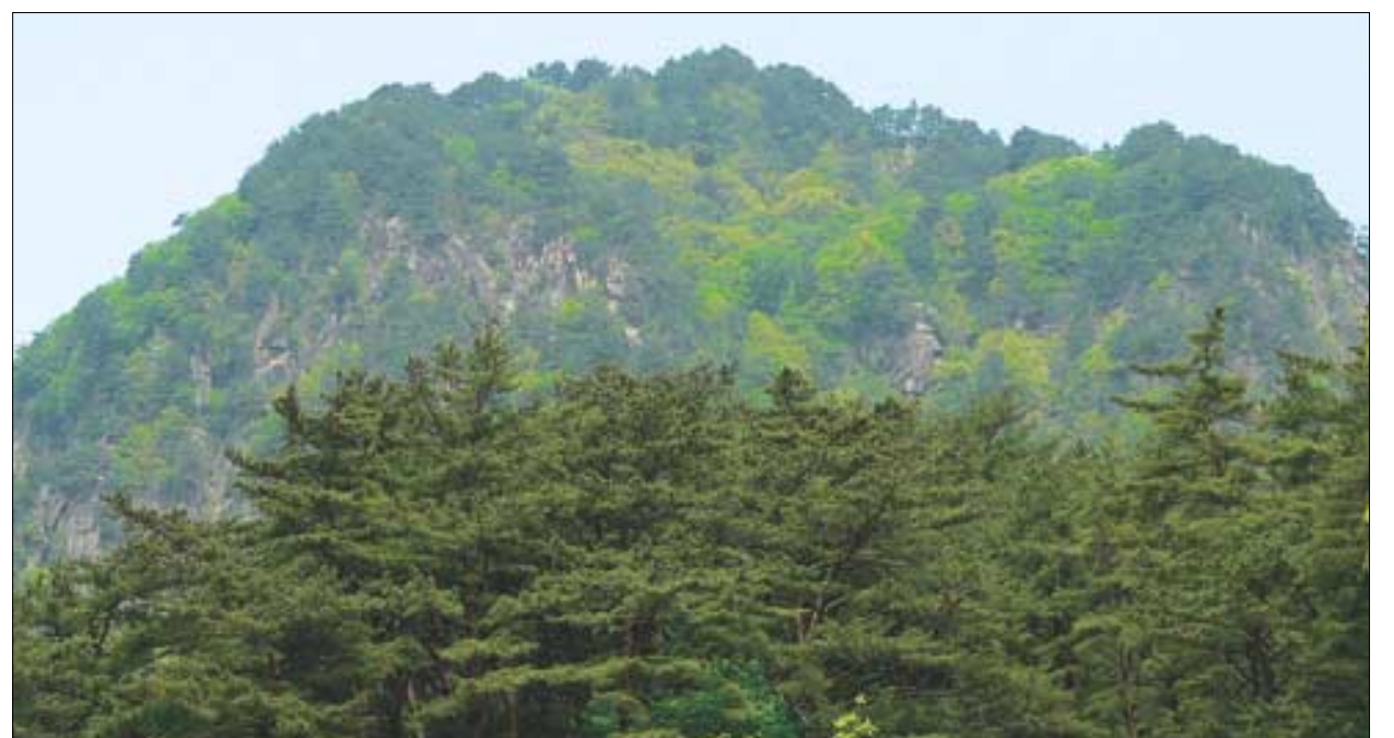
사람들은 사자산 골짜기를 연잎에다 비유하고, 적멸보궁이 앉은 자리를 연꽃봉오리에 비유했다. 그래서 이름도 연화봉이다.

뱀나비과에 속하는 나비들은 모두가 양쪽날개에 뱀의 눈처럼 생긴 둥근 점을 갖고 있다. 외눈이지옥사촌나비도 칙칙하고 어두운 날개 양쪽에 점이 나 있다. 이름이 풍기는 이미지와는 달리 화사한 5-6월에 나타나 꽃의 꿀을 찾는다. 가끔 그늘에 앉아 쉬기도 하고, 축축한 땅에 앉아 수분을 적어먹기도 한다.