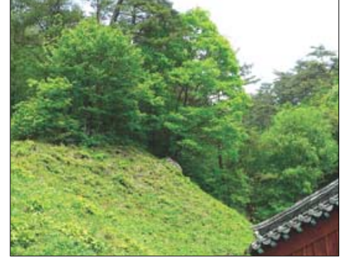
내화수림대는 산불이 주요 건축물로 번지거나 또는 경내의 화재가 산으로 옮겨가는 것을 막기 위해 전각 뒤쪽의 나무들을 베어내는 것을 말한다.