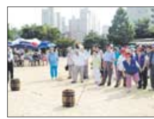
단오에 즐길 수 있는 전통민속놀이는 다양하다. 워부터 씨름, 그네뛰기, 창포에 머리감기, 투호놀이.