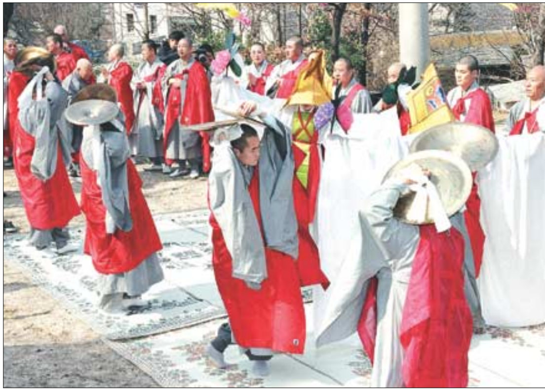
영산재보존회는 6월 11일 서울 봉원사에서 중요무형문화재 제50호인 영산재를 시연한다.

영산재보존회(회장 인공)는 서울 봉원사에서 중요무형문화재 제50호인 영산재를 공연한다. 영산재보존회의 중요무형문화재 제50호 단체 지정기념을 겸해 열리는 이번 영산재는 영산재 준보유자 구해 스님, 전수조교 일운·기봉·