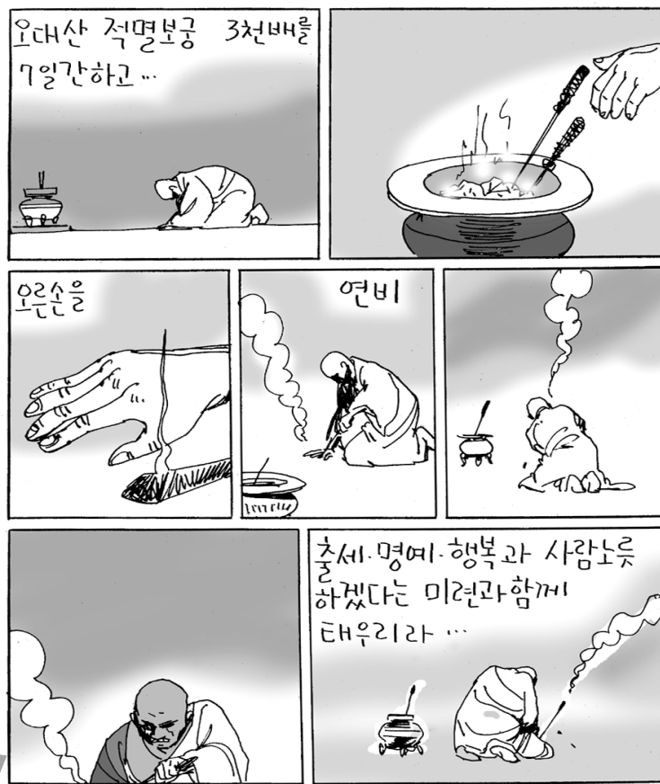
동곡 일타(東谷日陀:1929~1999): 1942년 통도사에서 출가. 조계종 단일계단 전계대화상·원로회의 의원 등 역임.