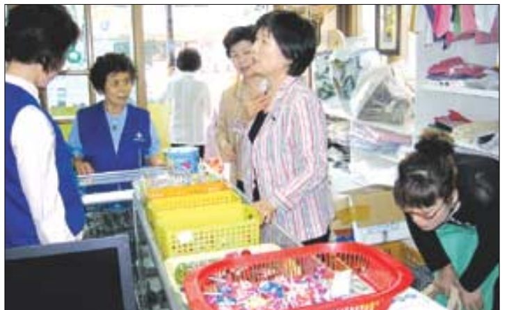
기증받은 물건을 팔고 나누고 다시 물건을 받고, 진각종 실상심인당 '한소쿠리'에서는 나눔의 순환이 실제없이 이뤄지고 있다.