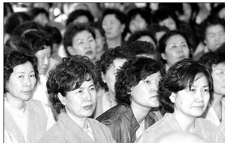
간화선법문에 진지하게 귀를 기울이고 있는 참가자들. 등록자 2985명중 10회 모두 참가한 수료자는 1374명에 달한다.

○...'국교보조금 횡령, 주지 자리 놓고 갈등.' 이런 부정적인 말들로 일간지를 장식했던 범어사. 심지어 '부산불교의 중심에 범어사는 없다'는 극단적인 말까지 감내해야 했다. 그러나 이제는 범어사가 확 달라졌다는 긍정적인 평가가 곳곳에