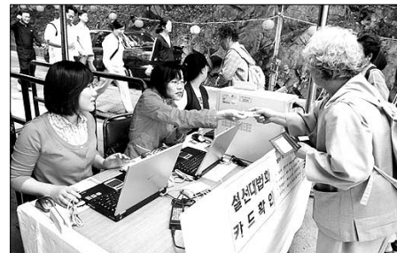
범어사는 설선대법회 참석 회수와 인거 참석 여부를 최첨단 ID카드에 기록하는 시스템을 불교계 최초로 도입해 참가자 관리의 효율성을 높였다.