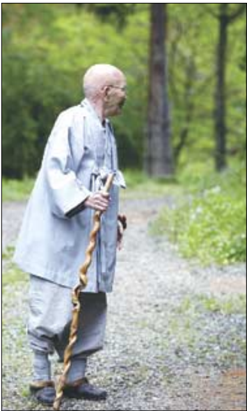
모든 수행의 기본은 좌업을 쉬고 마음을 기르는 ‘식업양신(息業養神)’이라는 동산 스님. 스님은 젊은 불자들에게 ‘식업양신’ 할 것을 당부했다.

그 말을 듣고 만공 스님이 뉘를 법단에 올라갔어. 그리고는 ‘지금 데라우치 총독이 무간지옥에 들어가서 환없는 고통을 받으니 우리 7천여 스님들이 스님 노릇을 잘해 총독의 지옥고를 면하게 하라’고 딱 법문을 하는 거야. 사람들은 어떻게 감당하려고 그런 말을 하냐고 추궁했지. 그래도 스님은 ‘언권(言權)은 나한테 있으니 가만히 있으라’며 ‘청정본연(淸淨本然)이니 운하출생산하대지(云何出生山河大地)’라 하고는 그 자리에서 ‘할’을 해 버렸어. 그때 나는 새도 떨어뜨린다는 미나미 총독도 별별 떨더군. 스님은 그만둘 대장부였어. 그러니까 총독이 스님을 상석에 모시고 대접을 했지.”