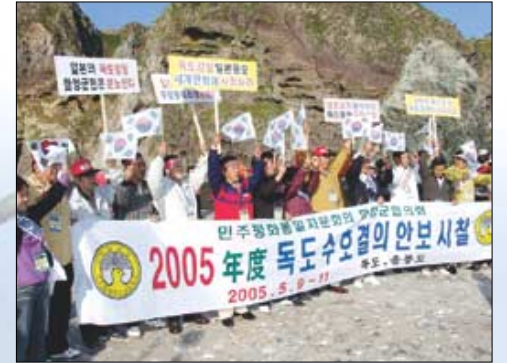
함께 독도에 입도한 합방군인들이 독도수호를 결의, 구호를 외치며 독도가 우리땅임을 재확인했다.