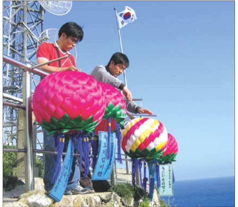
조계사 중무원들이 '평화의 씨를 뿌리는 자비의 등불이 되기를 서원하는' 연등을 등대 주위에 달고있다.