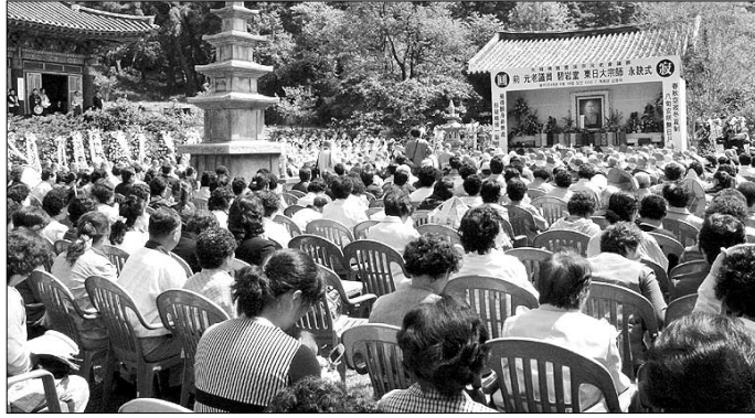
벽암당 동일대종사 영결식에는 1천여 사부대중이 참석했다.

생각도 비슷했다. “스님은 호 ‘벽수’처럼 원적에 들기 전까지 물 흐르듯 사셨습니다. 특히 사람은 분수를 알아야 되고, 때를 알아야 될 뿐 아니라, 자기 그릇을 알아야 된다면 이 세 가지 덕목을 강조했습니다.” <만행 하버드에서 화계사까지>로