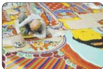
이리랑TV '한국불교미술의 꽃, 탕화'.