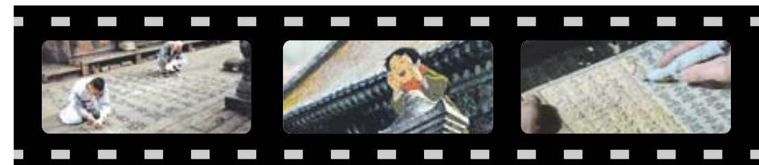
사진 왼쪽부터 KBS2 '봄 여름 가을 겨울...' '오세암'과 EBS 특선한국영화 '호국팔만대장경'.