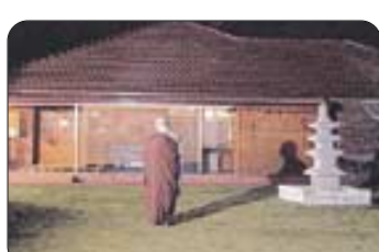
EBS 특집다큐 '그대는 이미 이르렀네'.