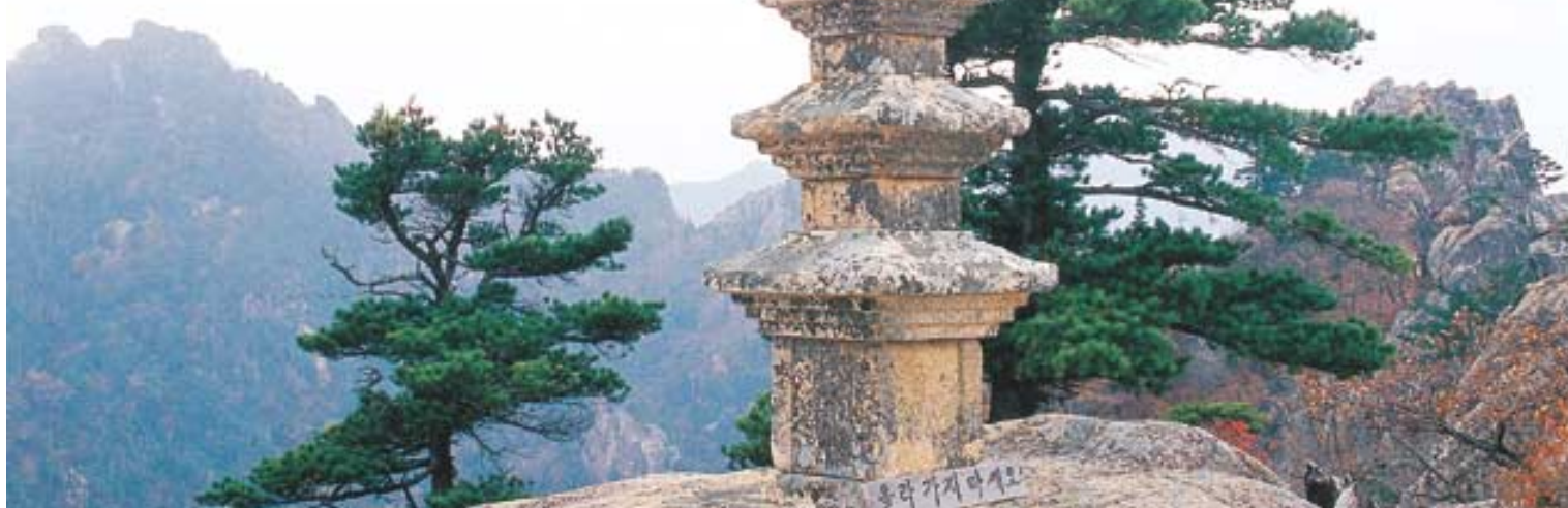
5대 적멸보궁 가운데 하나인 설악산 봉정암을 찾는 스님과 재가불자들의 구도역정을 그려낸 KBS1-TV스페셜 '봉정암'.

불기2549년 부처님오신날을 맞아 각 방송사마다 봉축 프로그램이 풍성하다. 방송되는 프로그램도 다큐멘터리, 음악회, 애니메이션 등 다양한 장르로 구성돼 있어 골라보는 재미도 쏠쏠하다. 이번 부처님오신날은 온 가족이 안방극장에 모여 불교관련 프로그램을 시청하며 불심을 키워보는 어떨까.