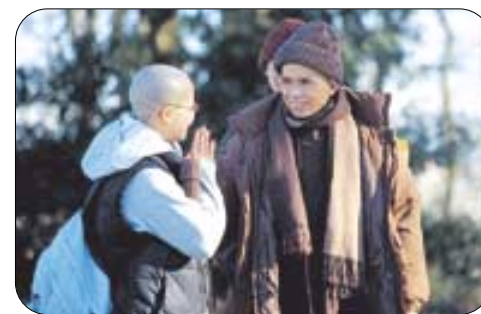
사진 왼쪽부터 불교TV의 봉축 특집 다큐멘터리 '하심이 곧 부처입니다' '승산 스님의 포교 여정' '달라이 리마 특별법문' '틱낫한 스님 특별법문'.