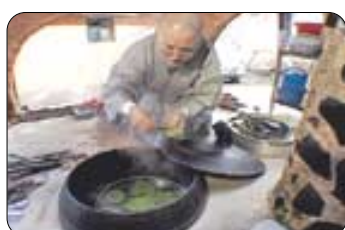
SBS 특집다큐 '절밥'.