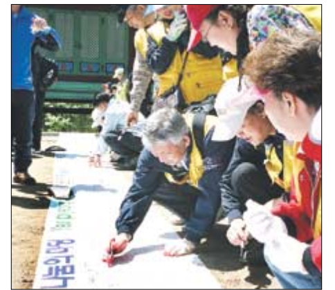
참가자들이 자신의 발원을 108m 길이 천에 적고 있다.

해지자고 한다. 그런 비문명적인(?) 생각을 듣고, 어떻게 하지는 것인지 보자고 사람들이 모여들었다. 전날까지 주룩주룩 내리던 비가 개고 청명한 하늘이 내려앉은 땅 월정사. 5월 6일 오전, 월정사의 시멘트 포장 걷어내기 행사는 그렇게 시작했다. 지난해 처음 시작한 이 해 2회를 맞은 오대산 천년의 숲길 걷기대회는 시멘트 포장을 걷어내고 자연으로 돌아가자는 모두의 약속으로 막이 올랐다.