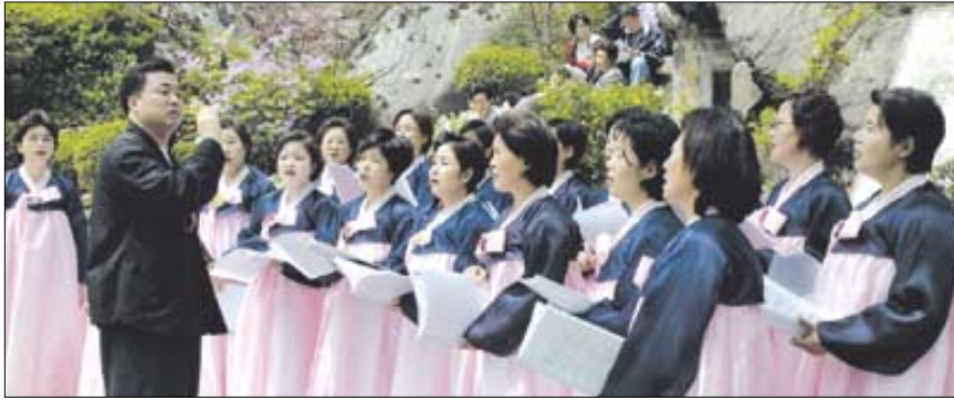
2000곡이 넘는 찬불가 가운데 널리 불리는 곡은 30~50여곡에 불과하다. 사찰합창단을 활용한 창작 찬불가 보급 방안을 고민해야 할 때다.

불교음악인 발공과 찬불가 보급을 목적으로 시작된 '창작 찬불가 공모'가 올해로 5회째를 맞았다. 조계종 총무원 주최로 1997년부터 격년제로 진행돼온 공모는 실질적인 성과가 미미한 탓에 '예산낭비'라는 지적을 수차례 받아왔다. 그러나 주최측은 올해 제5회 공모를 준비하면서 도약을 위한 새로운 시도를 보이기 시작했다. 가장 큰 시도는 공모작의 질적 수준을 고양시키기 위한 노력이다. 그간 공모에 작품을 제출한 이들 가운데 작곡 전공자는 20~30%에 불과했다. 대부분의 응모자들은 대중가요 스타일 작품들로, 불교음악에 대한 이해가 전혀 없는