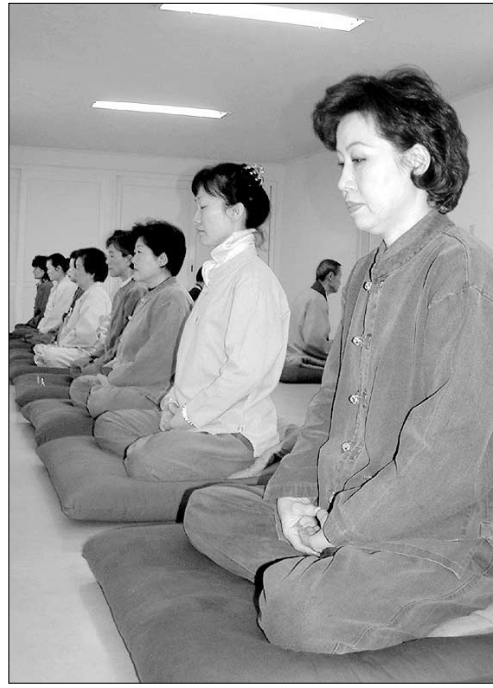
재가불자들이 4월 15일 서울 성북동 길상사 시민선원에서 참선 정진을 하고 있다.

국내 대학생 10명, 재가불자 20명도 함께 참여하는 이번 수련회는 참선 강의 및 실수, 선기공, 발우공양, 사