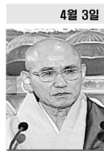
월주스님 전조계종 총무원장