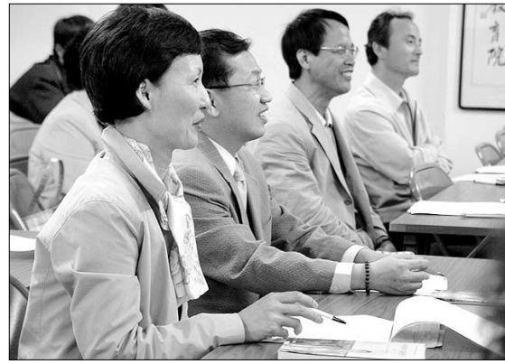
각목 스님의 강의를 듣고 있는 불자들.