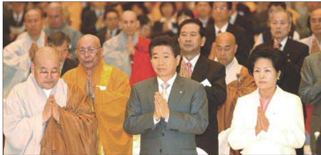
한국불교종단협의회가 4월 20일 서울 그랜드힐튼호텔에서 개최한 나라와 민족을 위한 기원법회에 참석한 노무현 대통령과 권양숙 여사, 조계종 총무원장 법장 스님(사진 앞줄 왼쪽 끝)이 합장을 하고 있다.