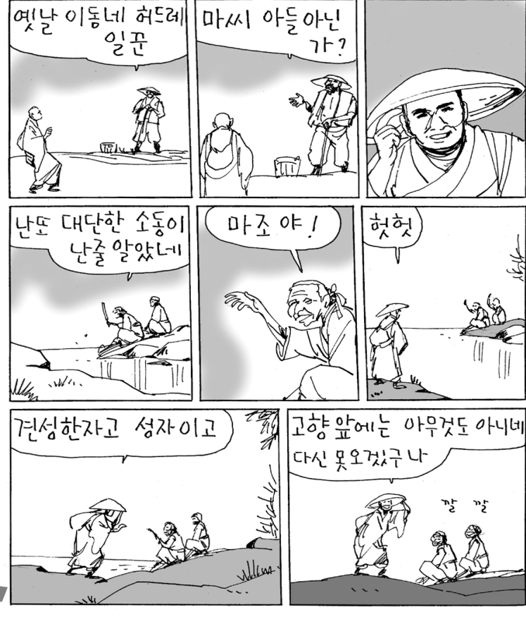
마조도일(709-788): 당대(唐代)스님. 사천성 한주 출신. 남악회향 문하에서 심인(心印)을 얻음. 석두회향과 더불어 선계의 쌍벽으로 불림. 저서로 <마조도일선사어록>이 있음.