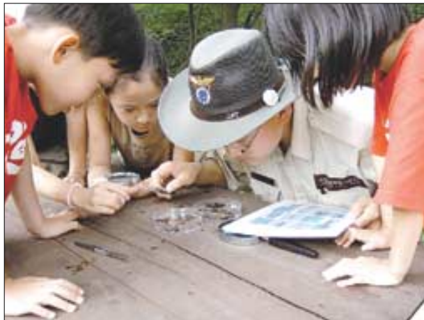
국립공원은 다양한 생태체험 프로그램이 마련돼 있다. 사진은 변산반도에서 곤충을 관찰하는 아이들의 모습.

국립공원관리공단 홈페이지(www.npa.or.kr, 02-3272-7931~3)에