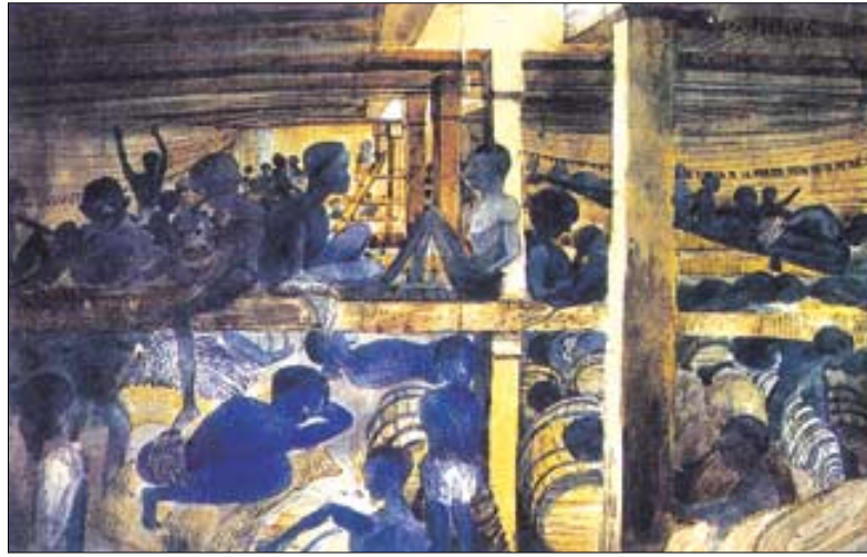
미국으로 들어오는 아프리카 흑인노예들을 태운 배안의 모습을 일러스트화 시켰다.