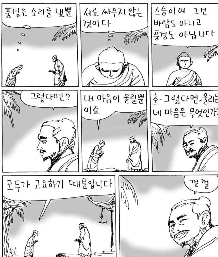
승가난제(?-?): 제17대조로 가나제바의 법을 이음. 인도 실라벌 출신으로 마제국에서 대중교화.