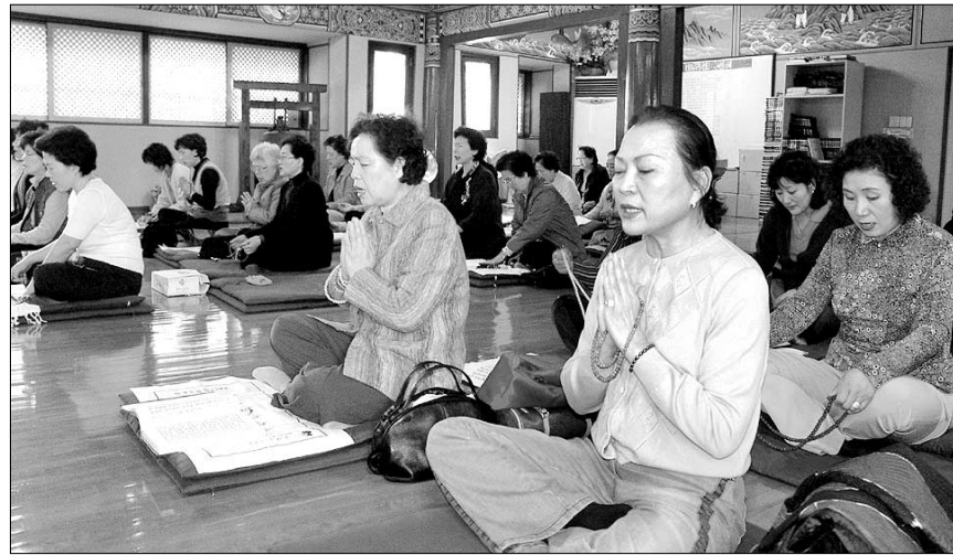
3월 27일 서울 수안사에서 열린 '천수다라니 백만 번 독송 기도법회 입재식'에서 2백여명의 불자들이 다라니 독송을 하고 있다.