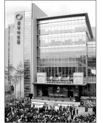
동국대가 수탁운영하는 '중구아트센터'.