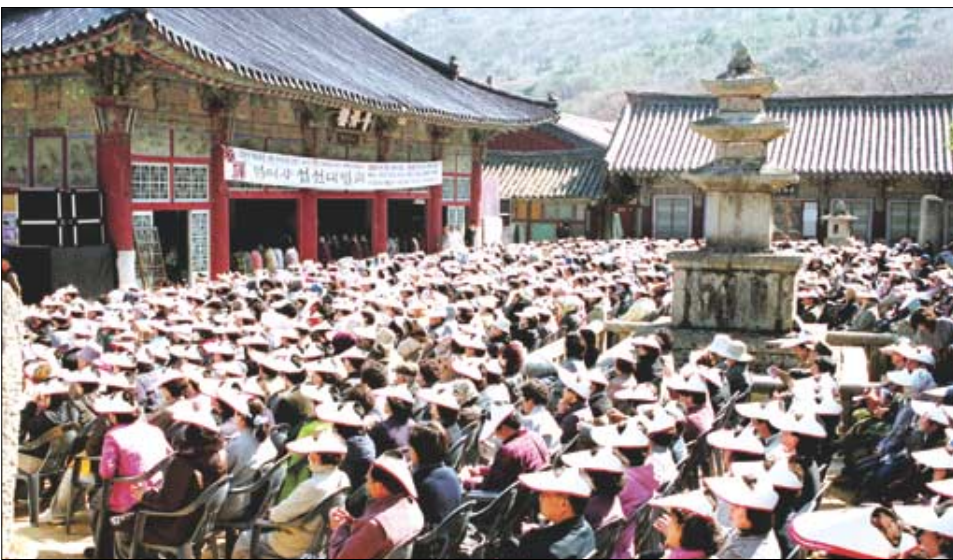
3월 19일 열린 고우스님 초청 법어사 설선대법회에는 4천여명이 참석, 고우스님 법문에 귀를 기울였다. 제법 때마침 불멸 때문에 행어 공부에 방해가 될 세라 법어사에서는 3천여개의 선캅을 준비해 참석자들에게 나누어 주었다.

수 있다면 화두가 없이 목조선으로서도 가능할 수 있지 않느냐? 이런 질문이 남을 수 있거든요.