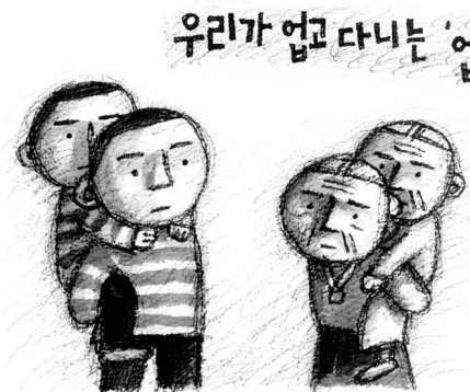
그림 : 문병성