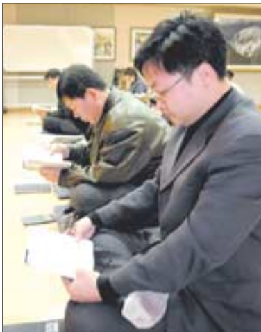
수원포교당 중무원들이 업무에 들어가기에 앞서 ‘법공양’을 올리고 있다.

“요즘 우리집 아들 녀석이 친구들과 다뤄 남 모르게 고민을 해왔던 모양입니다. 함께 등산을 갔다가 조심스럽게 얘기를 꺼내더군요. 다음날 가족들과 아침밥을 먹으면서 함께 이 경구를 묵송했습니다. 아들의 표정이 밝아지고 큰 목소리로 인사하면서 학교에 가더군요.”