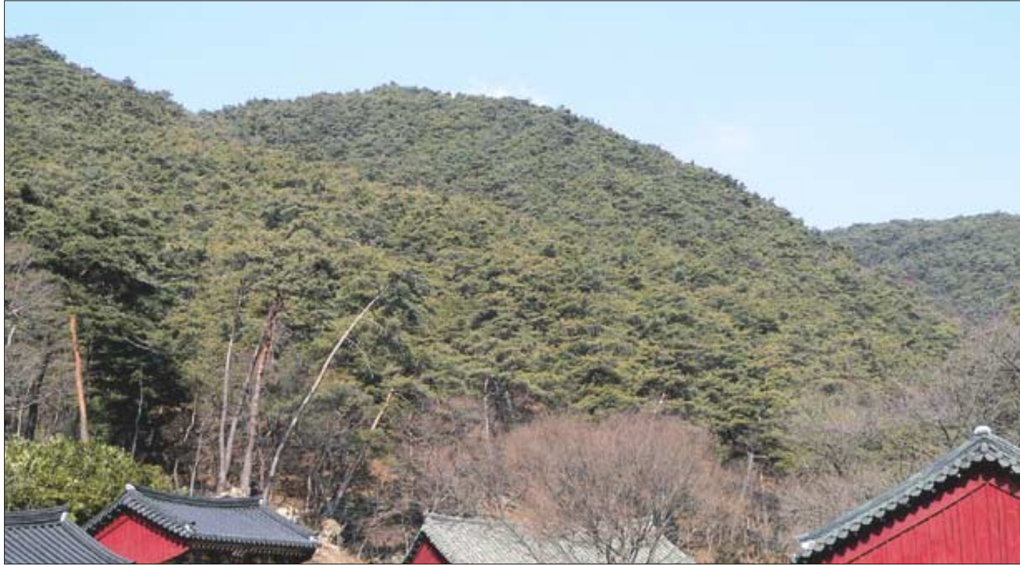
고운사 소나무는 30~40년생들이 주류를 이룬다. 그 그늘 아래에 어린 소나무들도 송송 올라오고 있어서 자연스럽게 세대교체가 이루어질 것으로 보인다.

숲을 벗어나면 저만큼 일주문이 보이고 경내가 시야에 들어온다. 고운사는 신라 신문왕 때 의상대사가 창건한 것으로 전해지지만, 200여년 뒤의 인물인 고운(孤雲) 최치원(崔致遠)과의 인연사가 더 깊다. 원래의 이름이었던 '高雲寺'가 '孤雲寺'로 바뀐 것도 그런 연유에서다.