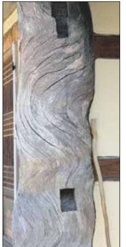
고운사 조실채 기둥

나한전 옆 조실채 기둥의 나무결이 눈길을 사로잡는다. 등천하는 울림이다. 나무는 죽어서도 사는 법을 알고 있다. 옆에 세워놓은 노스님의 지팡이가 대극적이다.