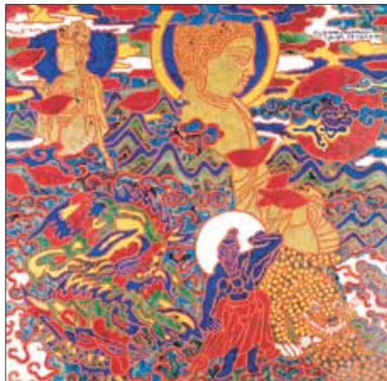
이영박물관에서 소장하고 있는 박생광의 '토함산 해돋이'.