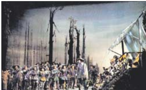
오페라 '마탄의 사수' 중 제1막 '숲속의 작은 숲집 앞'.

특히 오페라 '마탄의 사수'는 독일의 숲과 인간의 본질에 대한 두려움 속에서 삶의 매력을 찾아내는 신비로운 작품으로 한국 관객에