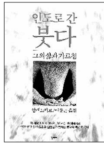
인도로 간 붓다 - 그의 삶과 가르침 암베드카르 지음 이상근 옮김 청미래 | 1만5천원

‘불가촉천민의 해방자’이자 ‘현대 인도불교의 중흥자’로 불리는 빌라오 람지 암베드카르(1891~1956). 힌두교의 전통적 신분제도인 카스트의 최하층계급인 ‘불가촉천민(하리잔)’으로 태어나 장관직에까지 오르며 소외된 사람들의 인권을 위해 싸웠던 그는 죽기 두 달 전인 1956년 10월, 자신과 같은 처지의 불가촉천민 수십만을 이끌고 불교로 개종했다. 인간의 평등권과 신분제 해방의 길을 불교에서 찾았기 때문이다.