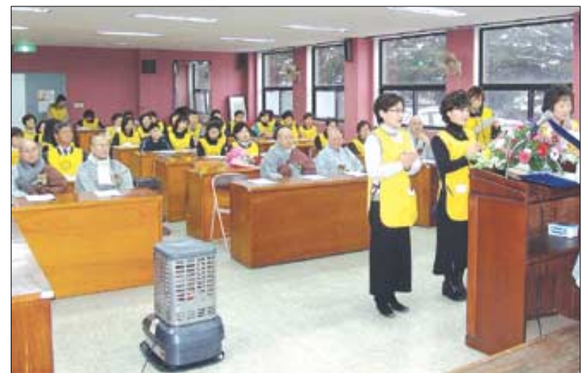
군위불교대학은 지난 1월 군위군민회관에서 합창단·봉사단·산행단 등 3개 신행단체 창립식을 갖고 본격적인 지역 포교에 나섰다.