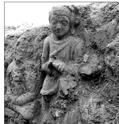
2000여년 만에 빛을 본 '간다라의 미소'. 석회와 모래 등을 섞어 빚어진 소상(塑像)·스투코이다.

됐다. 불상 가운데는 최초의 불상에 후대에 다시 회를 발라 부조한 2중 기법의 불상도 발견돼 간다라 불상 연구에 귀중한 자료가 될 것으로 평가된다. 발굴팀은 동전이 초기 쿠산시대인 1세기 것이고, 승방지와 주탑의 벽면 구조가 1~2세기에 유행한 것이며 초기의 힘찬 기법으로 조성된 2중구조의 불상 등이 있는 것으로 보아 1~3세기에 조성된, 이른 시기의 사원으로 추정했다. 박익순 기자 ufo@buddhapia.com