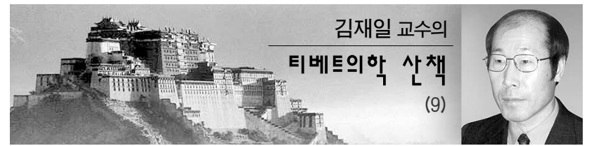
김재일 교수의 티베트의학 산책 (9)