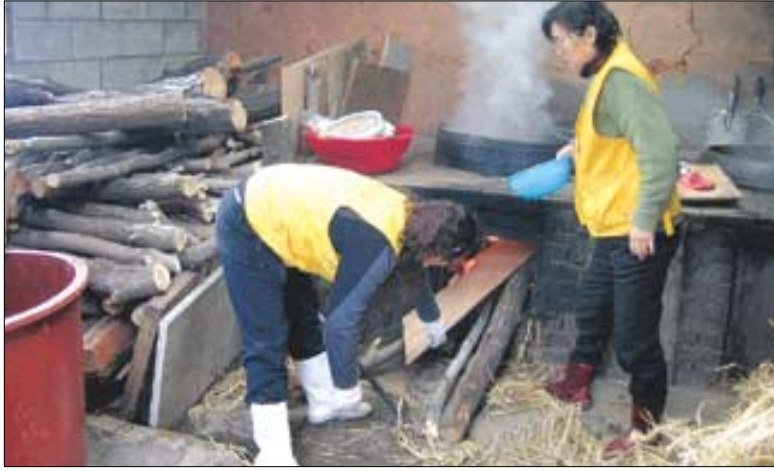
2월23일 화성 자제정사에 봉사활동을 나온 발우회 회원들이 호박죽을 끓이기 위해 아궁이에 장작을 넣는 모습.