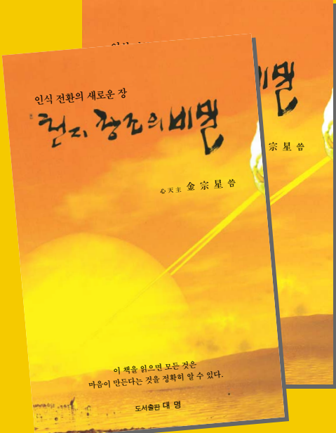
정가 8,500원 도서출판 대명 TEL.042)623-0829 FAX.042)621-0110

지식인(知識人)일수록 허황한 신(神·귀신) 이야기가 나오는 미신에 잘 빠진다.