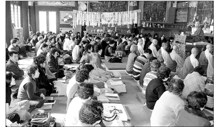
입춘기도 회향으로 2월4일 열린 중진 스님 초청법회. 개운사는 매월 관음재일 고승초청법회를 열고 있다.