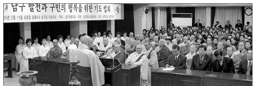
광주 남구 불교사암협이회는 창립을 겸한 효사랑 실천다짐법회를 봉행했다.