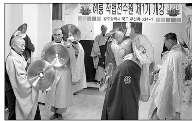
광주에 불교 영산재 전문교육도량인 해룡 작업전수원이 문을 열었다.

광주 해룡사(주지 해운)는 2월 17일 오전 11시에 해룡 작업전수원을 개원하고 제1기 개강식을 개최했다.