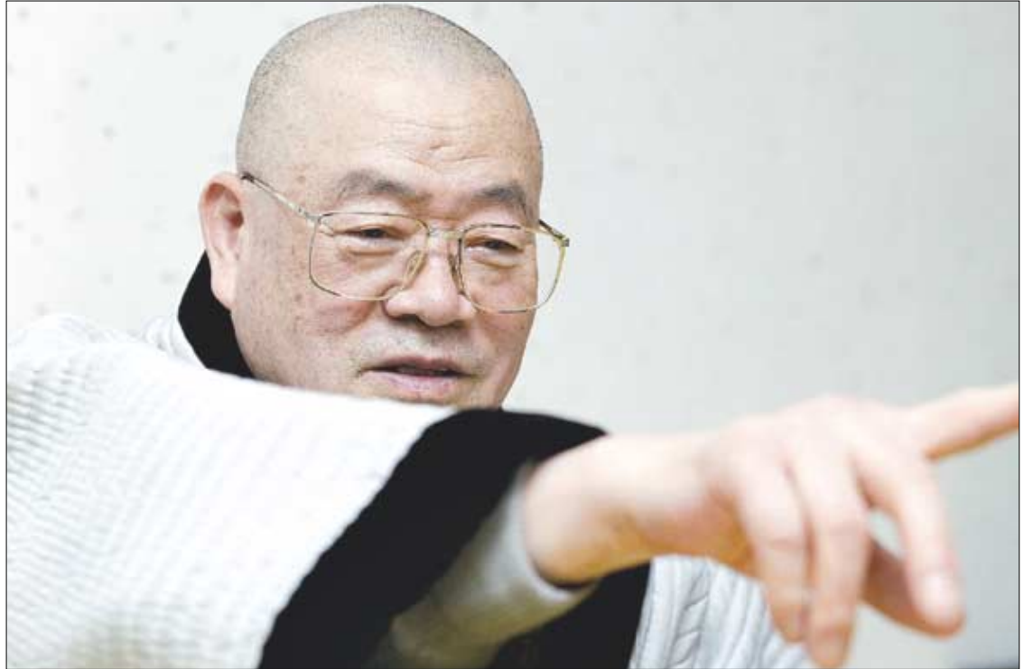
연화도 법회가 풍랑때문에 취소되자 안타까워하는 신도들에게 고산 스님은 "어떤 일이든 쉽게 이룬 일은 쉽게 어그러지고, 어렵게 이룬일은 오래가는 법이니 기도나 공부도 쉽게 이를 생각 하지말라"고 당부했다.

고 들어서 왔는데 잘 모르겠습니다.' 그는 저보다 앞서 그곳을 떠나갔는데 그가 남긴 여운에는 실망스러움이 가득 배어 있었습니다. 그는 그곳에 온 이유에 대해서 '좋은 것 같아서'라고 대답하였습니다. 초심자를 대상으로 불교에 대한 강의할 때 저는 종종 묻습니다. "왜 이곳에 오셨습니까?" 그런데 너무나도 많은 이들에게서 돌아오는 대답은 "...그냥요..."입니다. 불교공부를 좀 해보았지만 알 듯 모를 듯 하고 뭘 말하는 건지 종잡을 수 없다는 이들에게 '대체 뭘 알고 싶은가?'를 물으면 그들은 멧쩍은 듯 웃으며 고개를 가웃합니다. 번뇌에 시달리는 주인공도 자기이고 깨달음의 주인공도 자기이거늘, 자기가 왜 그곳에 있는지 무엇을 알고 싶어 하는지도 모르는 사람들에게 그 스승은 또 이렇게 말할 것입니다. "나는 너만 못하다. 네 스스로 깨달아라."