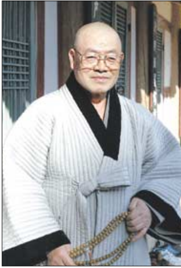
누구든지 일상을 살면서 부처님처럼 되려고 노력하는 것이 중요하다는 고산 스님.

것입니다. 집을 지을 때 기초를 튼튼히 다져야 하듯이 계획이 바로 그 기초에 해당합니다. 석암 스님께서 계행(戒行)을 청정히 지키면 계덕(戒德)으로서 이루지 못할 일이 없다는 말씀을 항상 하셨는데, 과연 그 말씀이 맞아요. 그리고 세상일은 이뤄 놓고 보면 잘한 일이다 하는 생각이 드는데 이루기 전에는 시시비비가 많아요. 부처님도 6년 설산고행 하고 또 두루 익힌 것을 종합해서 12년 수도를 해서 성불 했으니 세상 사람들이 존경하고 알아주지, 금방 가서 2~3일 만에 성불했으면 누가 믿어 주나요?”