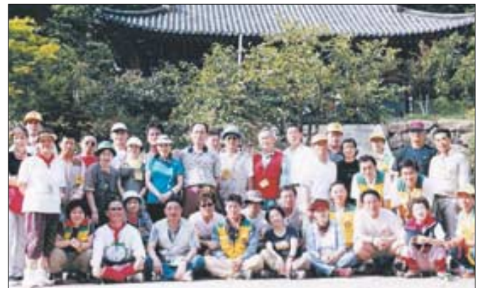
부산불교산악회는 산행을 통해 산이 주는 무언의 가르침을 배우는 산행모임이다. 사진은 지난해 9월 정기산행에 참가한 회원들의 모습.

산을 좋아하는 사람들이 모여 마음을 닦고 신심을 키우는 부산지역의 산악인 모임, 부산불교산악회입니다. 우리는 부처님 마음을 닦은 산이 주는 무언의 가르침을 몸으로 느끼며 언제나 실천하는 참불자가 될 것을 서원하고 있습니다. 우리 부산불교산악회의 태도는 1993년 12월로 거슬러 올라갑니다. 범어사에서 열린 창립법회에는 부산지역 불교산악인 150여명이 참석해 불교산악인 모임의 깃발을 이 외에도 우리 산악회는 영남과