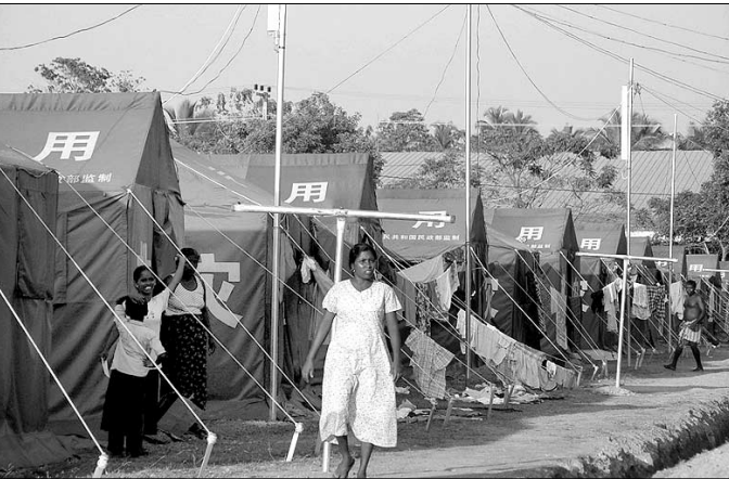
스리랑카 파나두라 시암종 사찰에 설치된 수재민들의 텐트. 사진은 600여명을 수용 중인 갈고다 캠프 모습.

찰 신도회장님들의 의견을 수렴해 가급적 빠른 시일 내로 전체 신도회장단 모임을 가질 생각입니다. 여기에서 중앙신도회 임원진을 구성하고 임원진 선거를 통해 중앙신도회장을 제대로 추대하도록 하겠습니다. 이런 기틀이 다져지면 내년부터는 본격적으로 중앙신도회 차원의 사업이 진행될 수 있을 것으로 생각합니다. ▲준비하는 사업은? -올 가을경 국제보살계 수계법회가 준비되고 있습니다. 이 행사는 신도들이 계율에 대해 배우고 수지할 수 있는 기회가 될 것입니다. 많은 신도들이 관심을 갖고 동참하는 행사가 되길 바랍니다.