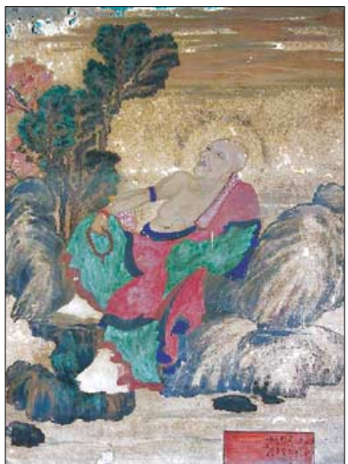
공주 한 사찰의 독성도(1933), 습기와 곰팡이로 인한 훼손이 심각하다.

확대 운영을 환영하면서도 “이 제도가 정착되기 위해서는 먼저 등록문화재와 지정문화재의 구별기준을 명확히 하고, 등록문화재의 현상변경 기준을 연구·확립해야 한다”고 말했다.