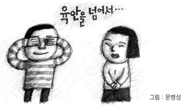
그림 : 문병성

이유 없이 미운 사람이 눈에 보일 때, 이유 없이 마음에 끌리는 모습이 나타날 때, 시각의 한계성을 되새기도록 하자. 그리고 그 느낌이 어디에서 일어나는지를 주시하는 습관을 불타다 보면, 어느새 <금강경> 가르침에 가까이 가게 될 것이다. ■서울대 전기공학부