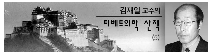
김재일 교수의 티베트의학 산책 (5)

재료: 무, 밀가루, 소금, 식용유, 사과초고추장(사과, 고추장, 식초, 통깨) 1. 무를 굵게 채 썰어 소금을 넣어 버무린다. 2. 무에 밀가루가 생기면 밀가루를 넣어 되직하게 반죽하여 달궀진 팬에 기름을 두르고 한 손잡씩 펴서 전을 부친다. 3. 사과초고추장: 사과를 강판에 갈아 고추장, 식초, 통깨를 넣어 초고추장을 만든다. 4. 무전에 초고추장을 얹어 먹는다.