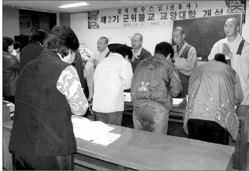
군위불교가 지역민과 함께하기 위한 활동을 시작했다. 사진은 군위불교교양대학 개설식 모습.