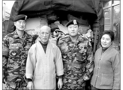
전쟁으로 고통받는 이라크 현지민을 위해 사할에서 의류 4000여점을 전달해 화제다.