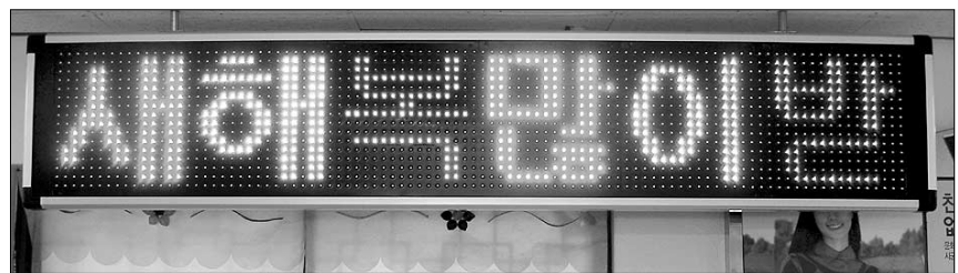
부산 두승중합사회복지관 입구에 설치된 전광판 모습.