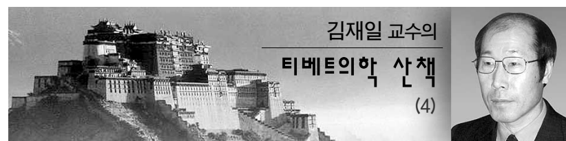
김재일 교수의 티베트의학 산책 (4)