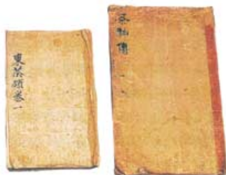
초의 스님이 쓴 <동다송>(과사진위) 조선 말기에 제작된 스님의 진영(사진 아래), 공인박물관 소장.

글=여수령 기자 snoopy@buddhapia.com