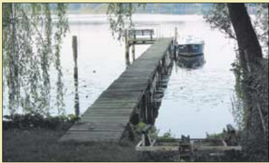
윤이상 선생이 생전에 자주 찾았던 베를린 집 근처 나루터. 선생은 호수를 보며 고향 통영의 기억을 되새겼다.