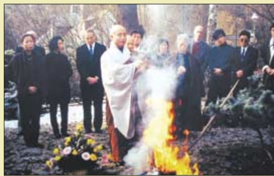
1995년 11월 윤이상 선생의 타계 당시 설정 스님이 베를린을 찾아 유족들과 유품을 태우고 있다.

양의 기법으로 완벽하게 복원해 호평을 받았다. 이밖에도 불교전통음악인 범패를 소재로 만든 <나모> 등도 불교적인 정서가 녹아든 작품 가운데 하나다.